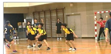
【7/17 女子ハンドボールの試合の様子】

残念ながら惜敗の部活動は、3年生が引退となりました。引退後はシフトチェンジして、次は進路実現に向けて努力を重ねてくれることでしょう。