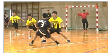
【7/17 男子ハンドボールの試合の様子】