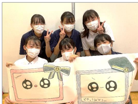
【美術部の作者のみなさん】

先月紹介した、粕屋中のタブレットキャラクター「タブくん」と「レットちゃん」の作者を紹介します。