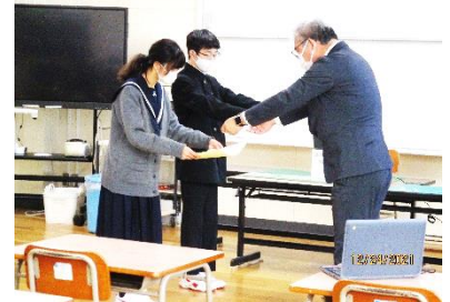
【リモートでの表彰の様子】