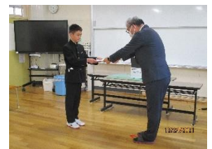
【認証を受けた新生徒会長】