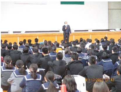
[校長からの話の様子]

奈良・京都の2泊3日の旅行、2学期中に事前学習を入念に行ったので、貴重な体験学習となることでしょう。