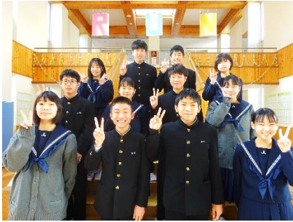
[生徒会役員の皆さん]

生徒会役員が、粕屋中学校のリーダーとしての心構えや役割、実務の内容を学ぶためのリーダー研修会を、年末の12月27、28日に行いました。粕屋中学校のこのようなリーダーになりたいとの思いを役員それぞれが明確にし、リーダーとなる決意を新たにしました。新しい生徒会のスローガンも話し合われ、新年と共に粕屋中生徒会がリニューアルされます。