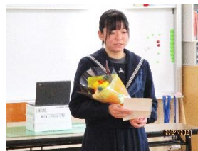
【退任した旧生徒会長】