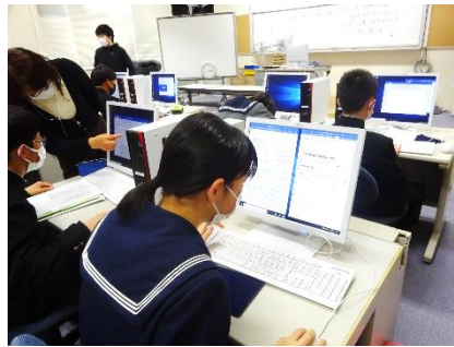
[1月の委員会原案を作成している様子]