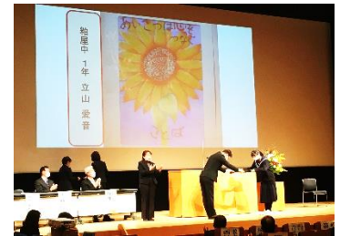
【粕屋町人権を尊重する町民のつどいでの表彰の様子】