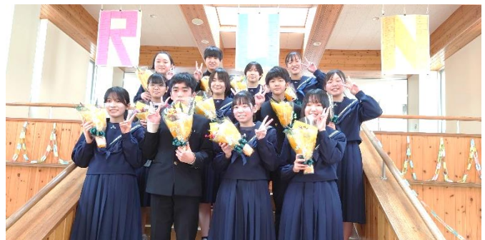
【退任した旧生徒会役員のみなさん】

新生徒会役員は、緊張の面持ちで認証式に臨みました。今日の決意を忘れず、旧生徒会役員の背中を追って、よりよい粕屋中を築く強固な礎となってくれることを期待しています。