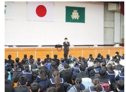
[旅行業者の方からの話の様子]