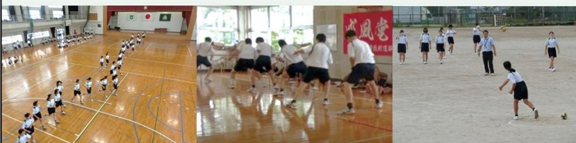
シャトルラン (持久力)

令和4年度 体力テストの様子 …… 体力の向上を目指し、学年ごとに実施しています。 Do Your Best!