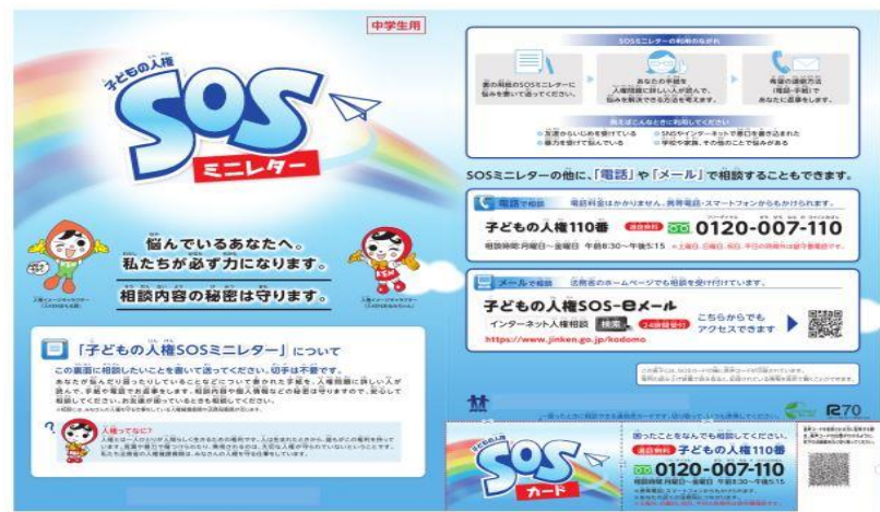
令和4年度「子ども人権SOSミニレター」（中学生用）表面

法務省の人権擁護機関では、学校におけるいじめや体罰、家庭内での虐待などの問題に対する活動として、全国の小学校・中学校の児童・生徒に「子ども人権SOSミニレター」を配布し、これを通じて教師や保護者にも相談することができない子どもの悩みごとを的確に把握し、学校及び関係機関と連携を図りながら、子どもをめぐる様々な人権問題の解決に当たっています。本校では、既に生徒を通して、この子ども人権SOSミニレターを配付しています。必要に応じてご活用下さい。