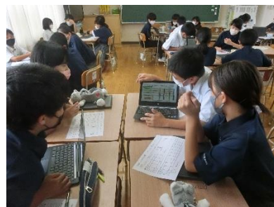
写真A 班内報告会の様子

また写真Bは、9月27日(火)に実施された各班代表者による各学級発表会の様子です。