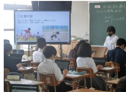
写真B 学級内報告会の様子

各学級において、各班代表となった生徒は、自身のプレゼンテーションに磨きをかけ、更に、自分の思いが伝わりやすいように話すリズムや声の強・弱、身振り等も工夫し、自分が調べた職業の良さを各学級で発表する姿が見られました。