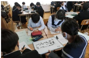
授業参観アンケート調査結果 (4段階評価)

学級活動の授業は、1・2年生は、体育会のスローガンづくり、3年生は、GWT(人間関係づくり)でした。今回の授業を通して、連休後にスタートする体育会の取組において、生徒たちの絆(きずな)が深まるきっかけとなることを期待しています。